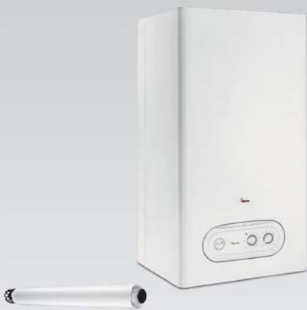
دودکش دوجداره مخصوص